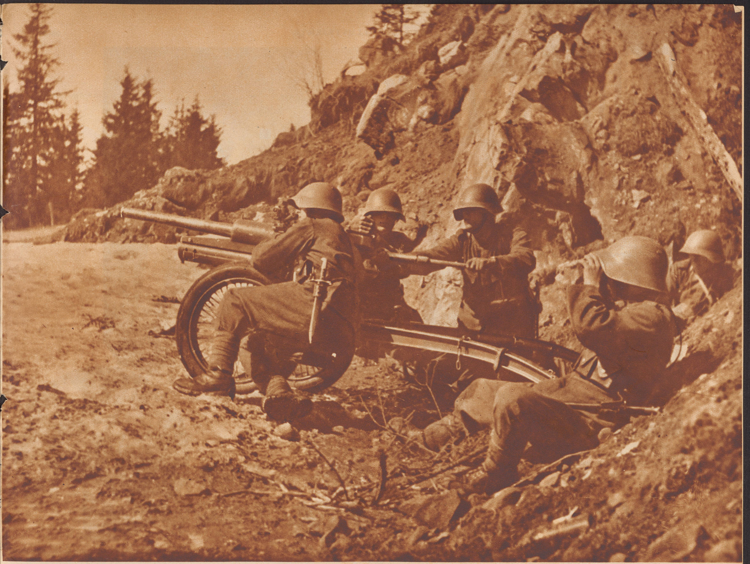
Infanteriekanone in Feuerstellung. Ihre Hauptaufgabe ist die Tankabwehr, die Bekämpfung von Maschinengewehrnestern und die Flugabwehr. Die größte nützliche Schussweite dieser 47 Millimeter-Kanone beträgt rund 5 km bei sehr guter Präzision. Versossen werden mit der Kanone Panzergranaten von 1,5 kg Gewicht, die auch die Panzer kleiner und mittlerer Tanks mühelos durchschlagen, sowie Sprenggranaten von 2,8 kg Gewicht zur Bekämpfung lebender Ziele. Zur unmittelbaren Geschützbedienung gehören 5 Mann: der Richter, der Schießende, der Lader, der Geschützchef und der Munitionsträger.