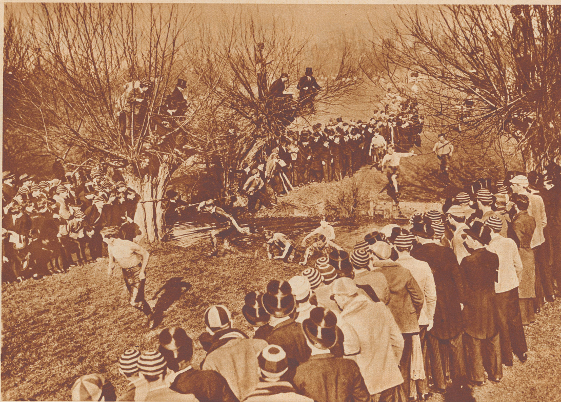
Durch Sumpf und Morast...