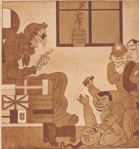
Völkerbund: «Pfui doch, Japsi, du solltest es der Tante doch wenigstens sagen, wenn du mal wieder ein bißchen Krieg spielen willst!» «Simplizissimus», München

Die sogenannten humoristischen Zeitungen oder Karikaturen der westlichen Länder werden nicht müde, das Thema des japanischen Kriegsgeistes oder das Thema Japan-Völkerbund zu behandeln. Es sind ein paar Schlagworte, die immer wieder illustriert werden, ganz entsprechend eben den oft einseitigen und ärgerlichen Darstellungen japanischer Dinge in den Tagesblättern.