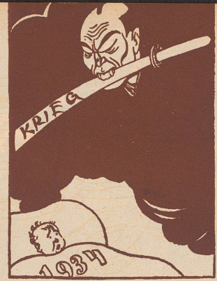
Ueber dem neugeborenen Jahr 1934 schwebt das japanische Kriegsschwert. «Iswestia», Moskau