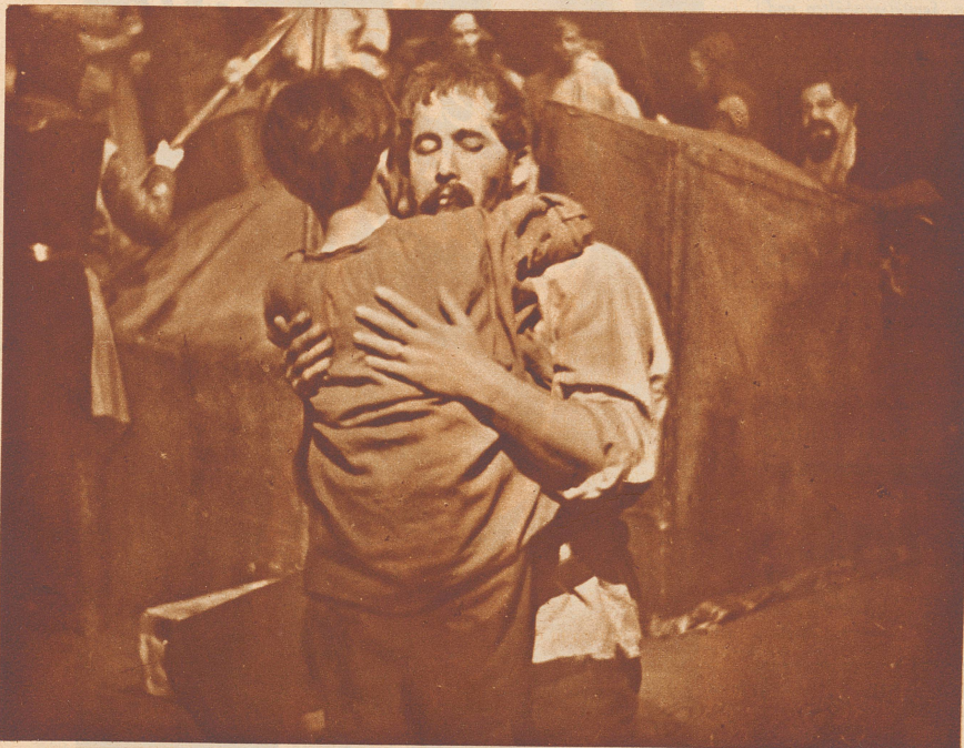
Nach dem Apfelschuß.

Szene aus dem alten Urner Tellenenspiel, das von einem unbekanntem schweizerischen Autor des 16. Jahrhunderts geschrieben wurde. Es bildet gewissermaßen die dramatische Urzelle des Schillerschen Tell und wurde diesen Winter von der «Freien Bühne Zürich» in einer viel beachteten Inszenierung von Heinz Rückert in Zürich und verschiedenen Schweizerstädten zur Aufführung gebracht.