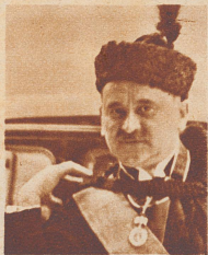
Ladislav Tahi von Tahovar und Tarko der neue ungarische Gesandte in Bern.