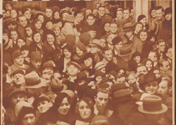
Die Wartenden. Im Vorraum des Orient-Kino drängen sie sich und rücken langsam vor, immer näher zu ihr, deren Abbild sie so oft auf der Leinwand sahen und vor deren leibhaftiger Gestalt sie nun in zehn, fünf oder gar schon in zwei Minuten stehen werden. Für zwanzig Rappen haben sie sich eine Karte gekauft. Brigitte wird sie in der Hand halten und ihre Unterschrift darauf setzen und unbezahlbar ist plötzlich das zwanziggräppige Stück Papier geworden, womit sein Besitzer die Erinnerung an ein Lächeln, an einen Augenaufschlag, an eine schöne Nackenlinie und an ein kleineres oder größeres Herzklopfen mit nach Hause nimmt.

Druck und Verlag: Conzett & Huber, Zürich und Genf