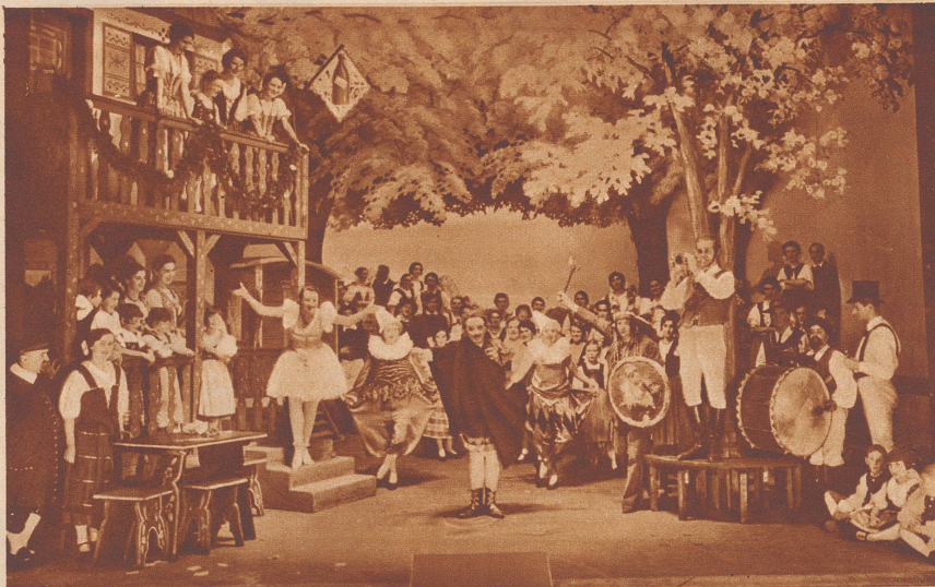
«Die verkaufte Braut»