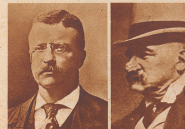
Theodor Roosevelt, 1901 bis 1909 Präsident der Vereinigten Staaten von Nordamerika.