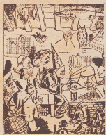
Roosevelt in der Karikatur. Roosevelt, der moderne Alexander, ein Columbus, ein Röntgen und ein anderer Columbus über «Normal» wird es nicht möglich, sich schulle zu bald wird. Sie werden sehen, aus Gold — Papier entstehen.

Roosevelt hat damit eine Mindergruppe angegriffen, an die sich bisher niemand herangewagt hat. Er kündigte eine Weltrevolution der Finanz an, seine Feinde lauern. Goldfreunde aller Länder, vereinigt Euch!