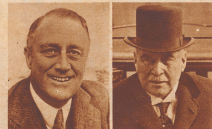
J.P. Morgan der Ältere, Begründer und Präsident der Morgan-Bank, geboren 1857. Franklin D. Roosevelt, der gegenwärtige Präsident von U.S.A., der jetzige Chef der Morgan-Bank und Präsident der Stillstrasse.

erste Phase seiner Rettungsaktion verlief im Sand. «Nicht mehr Mut!» sagte er und setzte sich mit seiner N. R. A. ans Werk; inzwischen mußte er wohl selber einsehen, daß die N. R. A., die erhoffte Rettung nicht gebracht hat. Er verzog aber nicht, er rief sich immer wieder Mut zu, und unerschrocken griff er mit seiner Politik der Goldbläse den Dollar in seinen Grundfesten an. Auch die rasche Entwertung des Dollars hat aber die dringend nötige Wendung zum Guten nicht gebracht. Roosevelts sagte sich, daraufhin, daß die Wendung zum Guten in der amerikanischen Wirtschaft gar nicht kommen kann, wenn die Geldentwertung nicht die ganze Welt, ohne wesentliche Ausnahme, erfaßt. Und mit wahrhaft bewundernswürdiger Klarheit er dem französischen Franken, diesem Bollwerk und Symbol der Macht des Goldes, den Krieg. Hinter dem französischen Franken steht aber nicht nur die französische, sondern die einheitlich geschlossene Weltmacht.