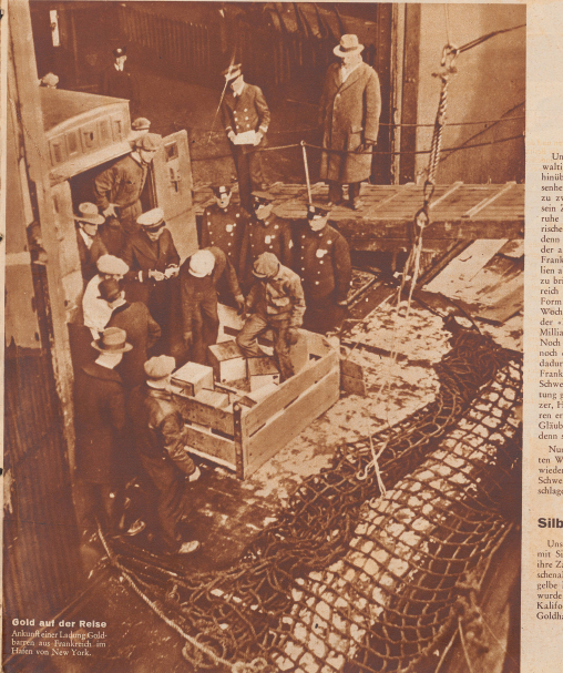
Gold auf der Reise. Anfang einer Lagerung Goldbarren, aus Boston, im Hofen von New York.