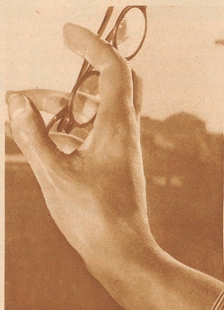
Hand eines Schriftstellers