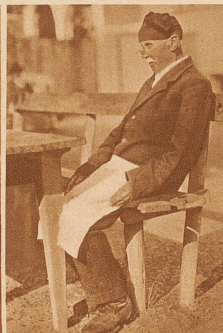
Ein 83jähriger Schneider wärmt sich in der Herbstsonne