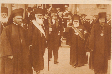
Eröffnung des rumänischen Parlaments. Nach längerer Unterbrechung wurde das Parlament in Bukarest zur besonderen Feierlichkeit wieder eröffnet. Die Finanzminister Nicolai Jorga (Mitte) vertritt, umgeben von führenden Geistlichen, die Kirche nach dem Eröffnungs-Gottesdienste und begibt sich in die Deputiertenkammer