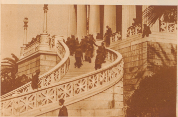
Im Anschluß an die Revolte der Cyprioten, die sich an Griechenland anschließen wollen, veranstaltete die griechische Regierung große Symposien Demonstrationen, die griechische Regierung aber, die mit England keinen Konflikt wünscht, bereitet den Kundgebungen durch Lösen von Polizei, Militär und Feuerwerke ein blühendes Ende. - Außerdem fliehen vor der Polizei in die Athener Nationalbibliothek