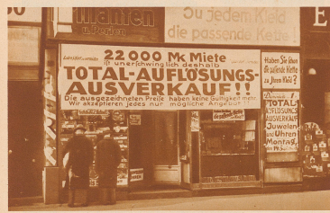
Die Ware wird verarmt, das Geschäft geschlossen! - so lautet heute die Losung unzähliger Berliner Geschäfte, besonders an eleganten Kaufmannsläden und im Zentrum, wo die hohen Lademeiere kaum mehr erträglich ist