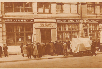
Ein neuer Bankkrach in Berlin. Seit dem Zusammenbruch der Danzabank stehen kein Bankkonten in Deutschland mehr zuverlässig fest zu stehen. Vor wenigen Tagen hat man auch eine der größten Berliner Banken, die Bank für Handel und Greditwesen, ihre Zahlungen eingestellt