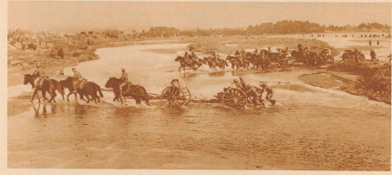
Zu den Kämpfen am Nonsud. Japanische Artillerie durchquert des Fluß, um in den Kampf gegen die Truppen General Ma's einzugreifen