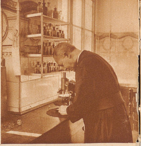
In dem Privatlaboratorium des leitenden Paters der wissenschaftlichen Abteilung. Eine ganze Reihe chemisch-biologischer Untersuchungen ist in den letzten Jahren aus dem Jesuiten-kloster in die Welt hinausgegangen