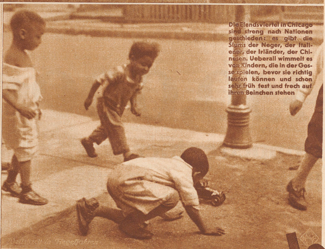
Die Elendsviertel in Chicago sind streng nach Nationen geschieden; es gibt die Stüms der Neger, der Italiener, der Irländer, der Chinesen. Ueberall wimmelt es von Kindern, die in der Gasse spielen, bevor sie richtig laufen können und schon sehr früh fest und frech auf ihren Beinchen stehen

Schriftstellers Heinrich Hauser, der durch seine Meer-Bücher «Die letzten Segelschiffe» und «Brackwasser» bekannt geworden ist. Er hat längere Zeit in Chicago gelebt und sich von dieser häßlichen, undisziplinierten, mit Verbrechern ringenden Stadt hinreißen lassen, von dieser Stadt, die ihm vorkam wie ein langer, schlacksiger Bengel von 14 Jahren, mit zu großen Händen und Füßen und schlechten Manieren, aber mit den schönsten Versprechungen für die Zukunft. Der Film zeigt vieles Unfertige, Brutale, das uns peinlich berührt; aber es ist schön, daß es einmal ein kluger Mensch unternommen hat, Amerika anders darzustellen, als «Gods own country», Gottes Lieblingsaufenthalt, oder als das Land, von dem sich der humanistisch gebildete Europäer mit Grausen wendet, — und daß er ganz einfach den Reiz des jungen, wilden, noch ungeprägten aber auch unbelasteten Lebens auf sich wirken ließ.