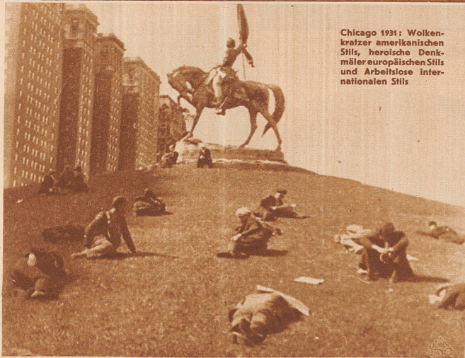
Chicago 1931: Wolkenkratzer amerikanischen Stils, heroische Denkmäler europäischen Stils und Arbeitslose internationalen Stils