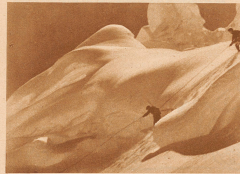
Schlafahrt durch die Spalten hinter dem kleinen Silberhorn