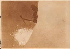
Langsame und mühsame Eisarbeit vor dem Abstieg über eine Eiswand auf dem Kälblanenen-Gletscher