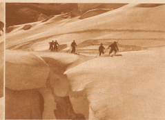
Vorsichtige Fahrt am gestaffelten Seil über den Guggelgletscher