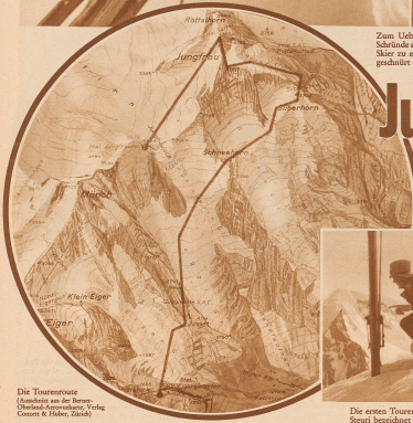
Die Tourenroute (aus dem von der Berner Gesellschaft herausgegebenen 'Vergleichen' von Comati & Hämmerli, Zürich)