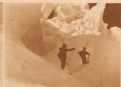
Querren einer Spalte in den Eisblöcken des Kälblanenen-Gletschers