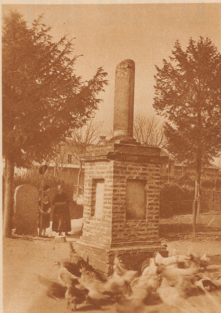
Das Schlachtdenkmal von Marignano im Hühnerhof eines Gutes beim Weiler Zivido

Gewaltig war der Aufstieg gewesen, über Morgarten, Sempach, Näfels und die Burgunderkriege, die den Kriegsruhm unserer Vorfahren über ganz Europa verbreiteten; und erst der Schwabekrieg, wo es ihnen gelang, sich die tatsächliche Unabhängigkeit vom Deutschen Reich mit den Waffen zu erzwingen! Dann folgten die italienischen Kämpfe, wo die eidgenössischen Söldner im Dienste Frankreichs und des Papstes, im Dienste Mailands und italienischer Potentaten Sieg um Sieg erfochten, so daß es genügte, Schweizer im Heere zu haben, und man war seiner Sache sicher. Die alte Eidgenossenschaft ist damals trotz des kleinen Gebietes, das zu ihr gehörte, die bedeutendste militärische Großmacht gewesen, — bis in Marignano plötzlich und unver-