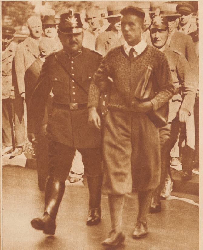
Bei den kommunistischen Tumulten vom 10. August am Bülowplatz wurden mehrere Polizei- und Zivilpersonen getötet. Ueber den Platz wurde der Belagerungszustand verhängt und alle Passanten nach Waffen durchsucht