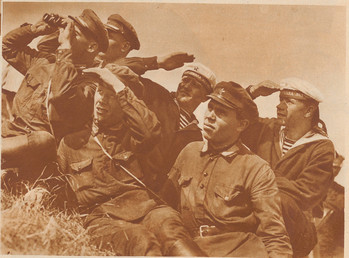
Bild rechts: Rotarmisten und Marinesoldaten beobachten den Rundflug des «Graf Zeppelin» über Leningrad

Die «Zürcher Illustrierte» erscheint Freitags • Schweizer Abonnementspreise: Vierteljährlich Fr. 3.40, halbjährlich Fr. 6.40, jährlich Fr. 12.-. Bei der Post 30 Cts. mehr. Postscheck-Konto für Abonnements: Zürich VIII 3790 • Auslands-Abonnementspreise: Beim Versand als Drucksache: Vierteljährlich Fr. 4.50 bzw. Fr. 5.25, halbjährlich Fr. 8.65 bzw. Fr. 10.20, jährlich Fr. 16.70 bzw. Fr. 19.20. In den Ländern des Weltpostvereins bei Bestellung am Postschalter etwas billiger. • Inserationspreise: Die einspaltige Millimeterzeile Fr. -.60, fürs Ausland Fr. -.75; bei Platzvorschrift Fr. -.75, fürs Ausland Fr. 1.-. Schluß der Inseraten-Aannahme: 14 Tage vor Erscheinen. Postscheck-Konto für Inserate: Zürich VIII 1576/9. • Redaktion: Arnold Kübler, Chef-Redaktor. Der Nachdruck von Bildern und Texten ist nur mit ausdrücklicher Genehmigung der Redaktion gestattet. • Druck, Verlags-Expedition und Inseraten-Aannahme: Conzett & Huber, Graphische Etablissements, Zürich, Morgartenstraße 29 • Telegramme: ConzettHuber. • Telephon: 51.790