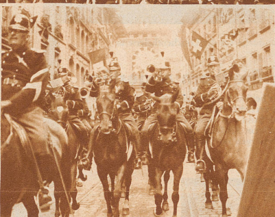
Die Berner Reiter-Musik in der alten, bunten Uniform der schweizerischen Kavallerie im Festzug