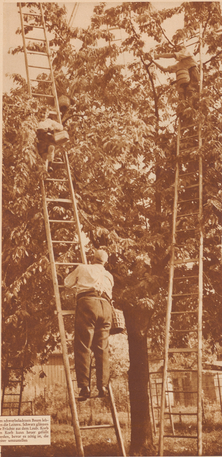
Am schwerbeladenen Baum leben die Leiter. Schwarz glänzen die Früchte aus dem Laub. Korbe um Korbe kann heuer gefüllt werden, bevor es zögert, die Leiter umzuwerfen.