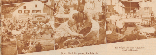
Auf dem Kirschenmarkt in Reichen bei Basel

Hi so, händ Sie gemeint, ich heb die Schöne roberichte? Sib' hümmer hümmer und mög, langed Sie da... bis runderdri i der Zäime: allen gleich aboo, gleich rot, gleich guet! Geduld Sie mee!