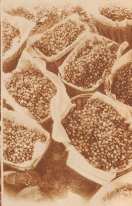
Die kindliche Ernte: blonde und schwarze, beide süß, beide erquickend!

Die Kirschen aus der Baslergegend gelten als die besten der Schweiz. Unbestreitbar haben sie auch den großen Vorzug, zeitlich die ersten zu sein. Zucht und Vereidung haben sie in jener Gegend zu ihrer heutigen Vollkommenheit gebracht. Heuer gibt's dort eine Rekordernste. Große, alte Bäume tragen bis zu 10 Zentnern Früchte. Die Äste biegen sich und scheinen milde von der Last. Das Kirschenpflücken ist zwar eine schöne, aber auf die Dauer doch anstrengende Beschäftigung. Man denke: Tagelang auf der Leiter stehen. — Ein gewandter Kirschenpflücker pflückt im Tag höchstens zwei Zentner. — Bei der heurigen Ernte fehlt's manderorts an den nötigen Helfern zum Helfen, denn die Kirschen waren eben nicht; wenn sie reif sind, wollen sie herunter vom Baum. Tun wir das unsrige, daß der Kirschenregen auch gut untergebracht werden kann. Essen wir Kirschen, das bekommt uns wohl und den Kirschenbauern auch. Bei den Kirschen kommen wir so ziemlich alle wieder ver-