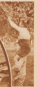
Möchte jetzt länger!

eint zusammen, ob wir Vegetarier oder Rohkünstler, Fleischesser oder Mazdaznener oder sonst etwas Absonderliches seien: die süßen Kirschen sind eine so freundlich-feine, zarte, eine so schöne Frucht, daß sie alle zu ihrem Anhängen macht; also: Essen wir Kirschen.