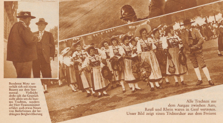
Rechtzeitig May am Markt und im Genévs. Bienen aus dem Berg, genévs, in Zürich, nicht die erste da hier die Trachten, sondern die hier Trachten aus Genévs sind diese Trachten aus dem Genévs Bergschützen