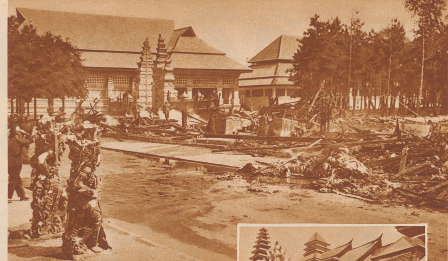
Brandkatastrophe in der Pariser Kolonialausstellung. In der Nacht vom 27. zum 28. Juni ist der holländische Pavillon der Pariser Kolonialausstellung durch Feuer vollständig zerstört worden. Der Pavillon war rein baulich ein Clou der Ausstellung und enthält unerschöpfliche Werte für den Kunst- und Kultur- des ostindischen Inselreichs. Der Schaden beläuft sich auf mehr als 10 Millionen Gulden. Will rechnet die Pavillon vor dem Brande. Oben: Die Überreste des Millionensbaus