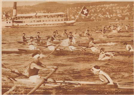
Internationale Ruderregatta in Zürich, 27. 28. Juni 1931 Start der Gäste-Vierer mit Steuermann, in welcher Kategorie die Société Nautique «Rocher» Bild Sieger blieb