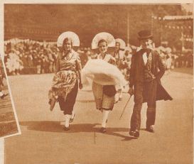
St. Gallen hatte mehrere Gruppen bergwärts, teils ordentlich zarte, teils halb weibliche, halb männliche, mit landschaftlicher Erquickung. Am meisten Beachtung fand diese würdevolle «partrische Tausche» aus der March