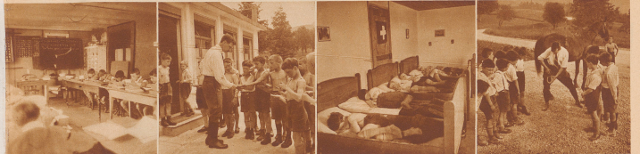
Die neue Schulstube auf dem «Hoggen»