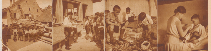
Buchholz, Eichen, Tannen! Führerstimme! Alles liegt da, waldig und im Leben erbeugend in der ganzen Hufe, nicht nur kleine Föhren, wir man sie sonst aus dem Scheitelsinnern. Da läßt sich herrlich erklimmen und befragen, was ein Kiefer, was ein Sten, was ein Buchen- oder Eichenbrett ist!