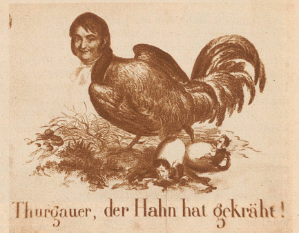
Thurgauer, der Hahn hat gekräht!

an seine Seite sich dränge. Dem Umstande, daß diese vermuthlich das auferlegte Stillschweigen nicht streng genug beachteten, sind die späteren Auftritte zuzuschreiben. Zwar ging der 3. Januar ruhig vorüber, am 4. aber wurde der Große Rath plötzlich in seinen Verhandlungen unterbrochen. Dampfe Gerüchte hatten sich verbreitet, Bornhauser sei ermordet worden. Mehr als 1500 Männer strömten buntbewaffnet und wuthentbrannt nach Frauenfeld, dem geliebten Tothen eine schreckliche Leichenfackel anzuzünden. Bornhauser suchte zwar durch seine Gegenwart und durch die Versicherung, er sei nicht angetastet worden, sowie durch offene Briefe, die Zürnenden zu beschwichtigen; sie be-