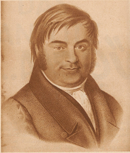
Pfarrer Thomas Bornhauser der einflußreiche Führer in der politischen Umgestaltung der regenerationsbedürftigen Schweiz anno 1831

«Der Hahn hat gekräht, die Morgenröthe bricht an, Thurgauer, wachet auf, gedenkt eurer Enkel und verbessert eure Verfassung!» Mit diesen Worten schloß der kaum 30jährige Pfarrer Thomas Bornhauser seine Schrift «Ueber die Verbesserung der thurgauischen Staatsverfassung», die ihn zu einem der einflußreichsten Führer zur politischen Umgestaltung der regenerationsbedürftigen Schweiz machte. Der «Natternbrut der Aristokratie» wollte er ein Ende bereiten und arbeitete von 1826 an auf eine Verfassungsreform hin, die neue Volksrechte (Rechtsgleichheit der Bürger, Preß-, Gewerbe-, Petitionsfreiheit usw.) bringen sollte.