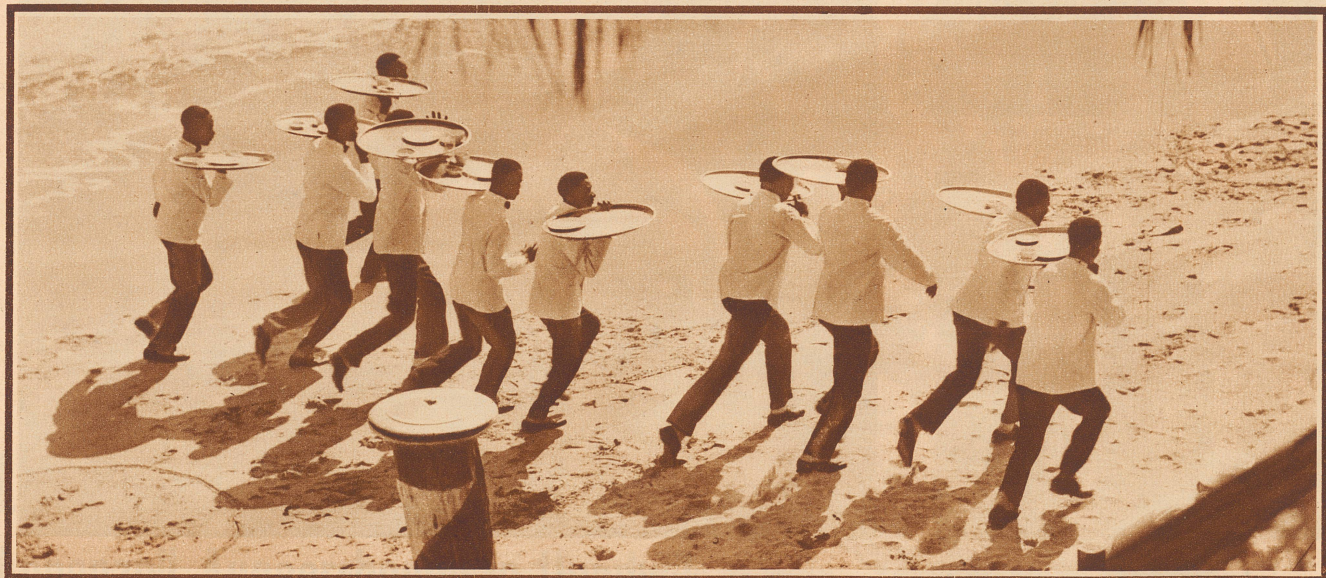
Al Capones Ferienort. Unter den Millionären, die in Miami an Floridas Küste den Winter verbringen, sitzt hier und da auch Al Capone. Hier rennen die schwarzen Kellner um die Wette vor den reichen Herren des Nordens. Wer zuerst mit dem Tablett ans Ziel kommt und am wenigsten verschüttet, gewinnt. «Harmloses Vergnügen», denkt Al Capone