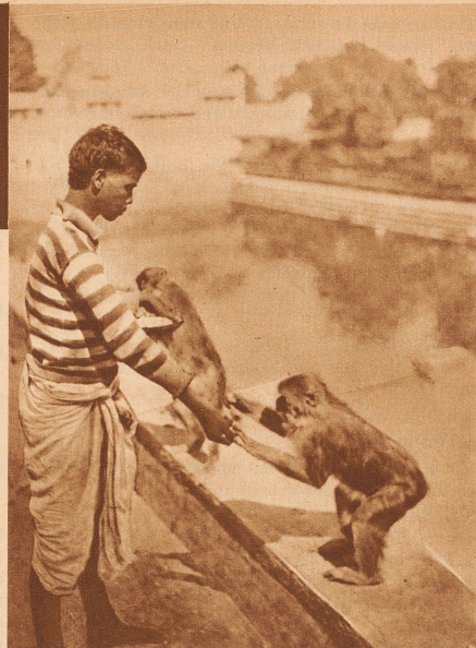
Der braune Junge und die Affen

Daß ihr euch die Geschichte allein ausdenken sollt, darum brauche ich euch wohl nicht erst zu bitten, oder?