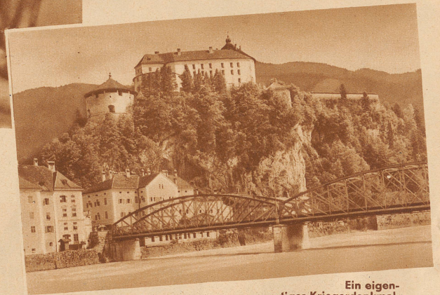
Ein eigenartiges Kriegerdenkmal.

Im runden Turm (links im Bilde) der Feste Geroldseeck, am Städteingang von Kufstein im Tirol wird zurzeit eine Riesenglocke mit 1813 Pfeifen und 26 Registern zum Gedächtnis der im Weltkrieg gefallenen Deutschen und Oesterreicher eingebaut. Der Ertrag der Konzerte, die außer im 1000 Personen fassenden Konzertsaal in kilometerweitem Umkreis gehört werden können, soll der Kriegsblindenfürsorge Deutschlands und Oesterreichs zugute kommen