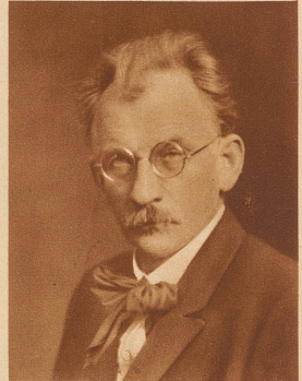
Der Beethoven-Preis für das Jahr 1931 in der Höhe von 10000 Mark ist von der preussischen Akademie der Künste dem Komponisten und Dirigenten Prof. Hans Pfitzner verliehen worden.