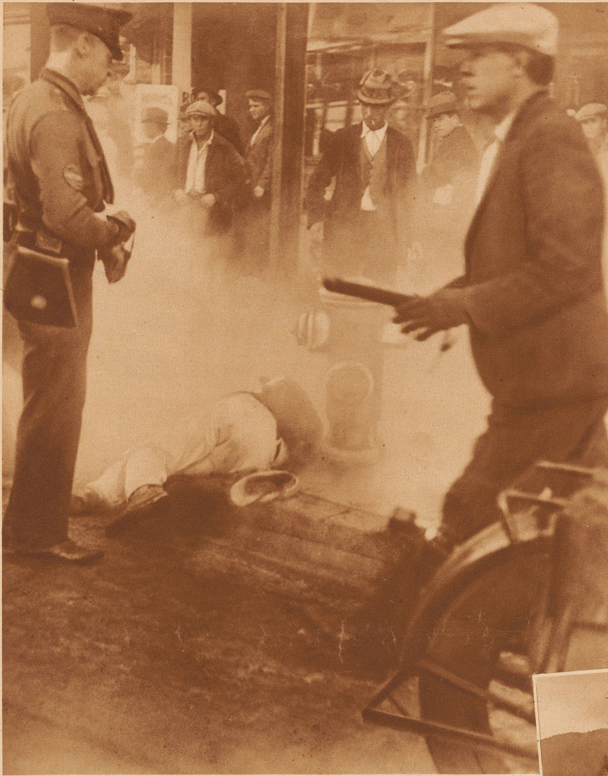
Vor dem Rathaus in Los Angeles kam es anlässlich einer Demonstration von Kommunisten kürzlich zu einem Straßenkampf zwischen Polizisten und Demonstranten . Um die Ruhe wieder herstellen zu können, mußte von der Polizei mit Tränengas vorgegangen und in zahlreichen Fällen von Gummiknüppel und Boxhandschuhen Gebrauch gemacht werden