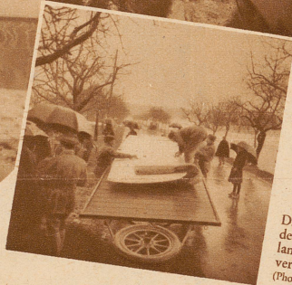
Die Tragflächen werden auf dem 5 Meter langen Flügelwagen verstaут