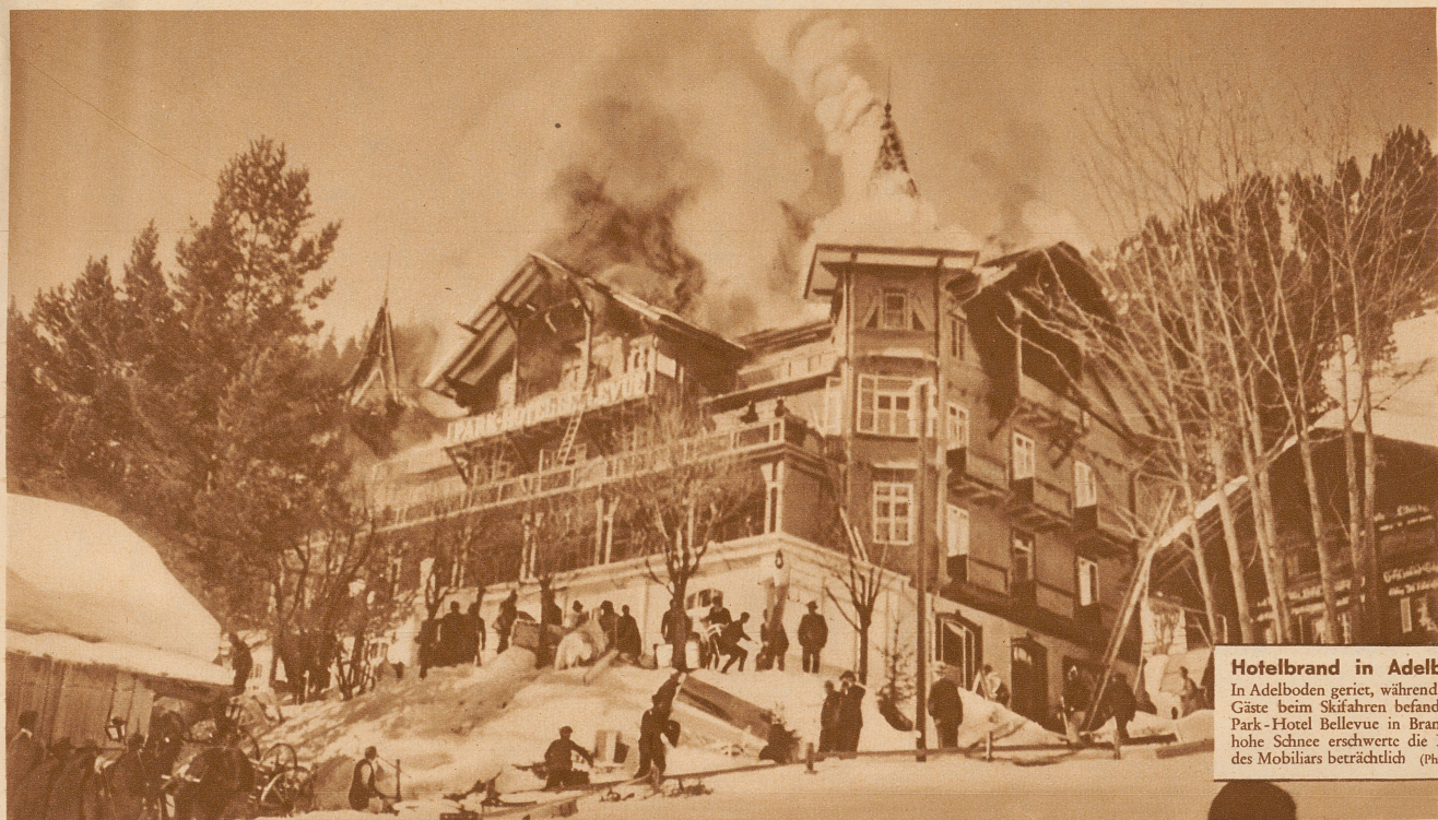
Hotelbrand in Adelboden In Adelboden geriet, während sich die Gäste beim Skifahren befanden, das Park-Hotel Bellevue in Brand. Der hohe Schnee erschwerte die Rettung des Mobiliars beträchtlich