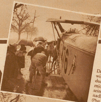
Der Flugzeugrumpf wird mit dem Landungssparren am Camion befestigt und auf seinen eigenen Rädern nachgezogen