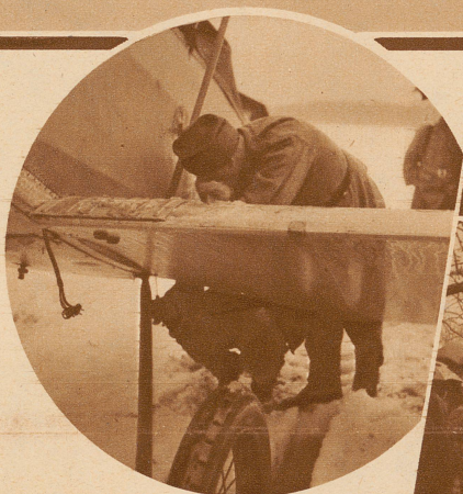
Das DH. 5-Flugzeug mußte bei Herzogenbuchsee notlanden. Zum Abtransport mußten die Tragflächen demontiert werden

Zum Wiederholungskurs der Fliegerkompanie 9, die in Thun einrückte, wurden die Flugzeuge von Dübendorf, wo sie stationiert sind, nach Belp geflogen. Ein Apparat mußte bei Herzogenbuchsee wegen starkem Nebel auf einer überschnitten und verwässerten Wiese notlanden. Wieder zu starten war wegen des schlechten Bodens unmöglich. Das Flugzeug wurde demontiert und durch Bern nach Belp geschleppt. Die anderen Apparate waren inzwischen nach Belp gelangt, wo von der Mannschaft Zelt-Hangars aufgestellt worden waren. Aber auch hier verursachte der außerordentliche Schneefall vom 7., 8. und 9. März große Schwierigkeiten. Die Flugzeuge mußten mit Hilfe von Pferden in die Hangars gebracht werden.