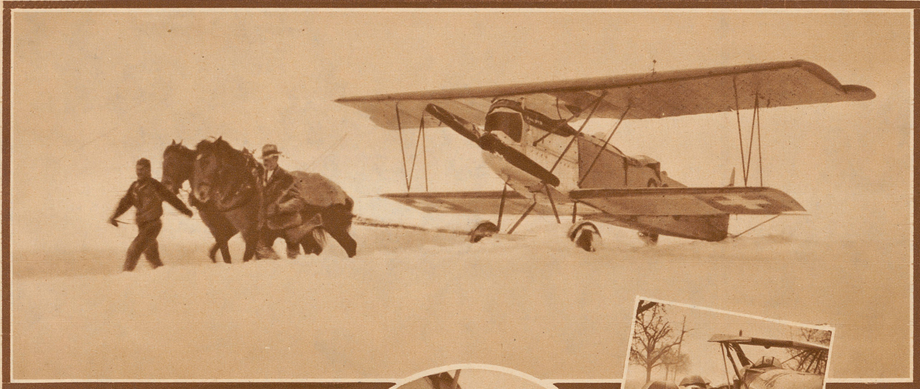
Mit zwei P. S. werden in Belp auf dem Flugplatz der «Alpar» die Fokker in die Hangars geschleppt