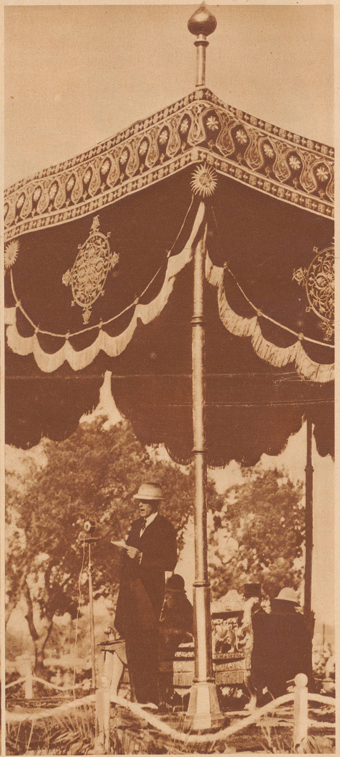
Lord Irvin , der Vizekönig von Indien, spricht durch das Mikrophon zu Tausenden geduldig zuhörenden Indern. Ihm ist der große Wurf gelungen, der Friedensvertrag mit Gandhi, dem ungekrönten König. Trotzdem ist die definitive Selbständigwerdung Indiens nur noch eine Frage von Jahren

Die «Zürcher Illustrierte» erscheint Freitags • Schweizer Abonnementspreise: Vierteljährlich Fr. 3.30, halbjährlich Fr. 6.30, jährlich Fr. 12.—. Bei der Post 30 Cts. mehr. Postscheck-Konto für Abonnements: Zürich VIII 3790 • Auslands-Abonnementspreise: Beim Versand als Drucksache: Vierteljährlich Fr. 4.50 bzw. Fr. 5.25, halbjährlich Fr. 8.65 bzw. Fr. 10.20, jährlich Fr. 16.70 bzw. Fr. 19.80. In den Ländern des Weltpostvereins bei Bestellung am Postschalter etwas billiger. Insertionspreise: Die einspaltige Millimeterzeile Fr. —.60, fürs Ausland Fr. —.75; bei Platzvorschrift Fr. —.75, fürs Ausland Fr. 1.—. Schluß der Inseraten-Annahme: 14 Tage vor Erscheinen. Postscheck-Konto für Inserate: Zürich VIII 15769