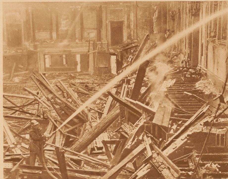
Eine Feuersbrunst zerstörte in London den Konzertsaal des Volkspalastes, die berühmte Queens Hall. Ein wirrer Trümmerhaufen bedeckt den Boden des einst so prunkvollen Gebäudes, in dem 2500 Personen Platz fanden

Eine neue Maschine zur Erlernung des Fliegens. Da sie in ihrer Beweglichkeit dem freifliegenden Flugzeug durchaus entspricht, bildet sie ein wertvolles Lehrmittel zur Instruktion. Der Fluglehrer (ganz links am erhöhten Pult) gibt dem Schüler Anleitungen mit Hilfe von farbigen Lichtsignalen, die am Schaltbrett des Führersitzes aufleuchten