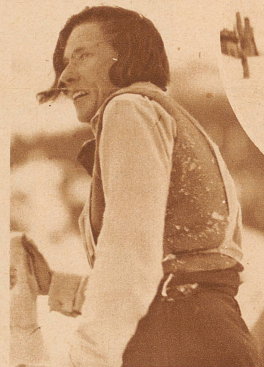
von Genf wurde Dritte im Frauen-Rennen. Zweite war die Engländerin Butler