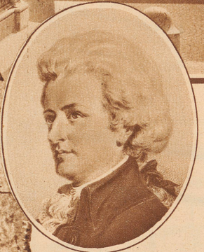
Der leicht idealisierte Mozartkopf, wie wir ihn seit unseren Kindertagen kennen. Nach einem Stahlstich von C. Jaeger

Das alte Oesterreich, die unhaltbarste Unternehmung der Weltgeschichte, besteht nicht mehr. Vor den ungläubigen Augen derer, die es liebten, die als Kinder in der Schule sangen: «Habsburgs Thron wird ewig stehen, Oesterreich kann nicht untergehen» ist es mit Krach und einiger Staubentwicklung in viele Teile und Teilchen zerfallen, die nun munter in die Höhe schießen und ihre allösterreichische Herkunft heftig verleugnen. Uebriggeblieben ist das deutschösterreichische Kernland mit seiner glorreichen Vergangenheit, mit seiner viel zu großen Hauptstadt, die jahraus, jahrein um 30000 Einwohner abnimmt, mit seinem unbeweglichen Heer abgebauter kaiserlich-könig-