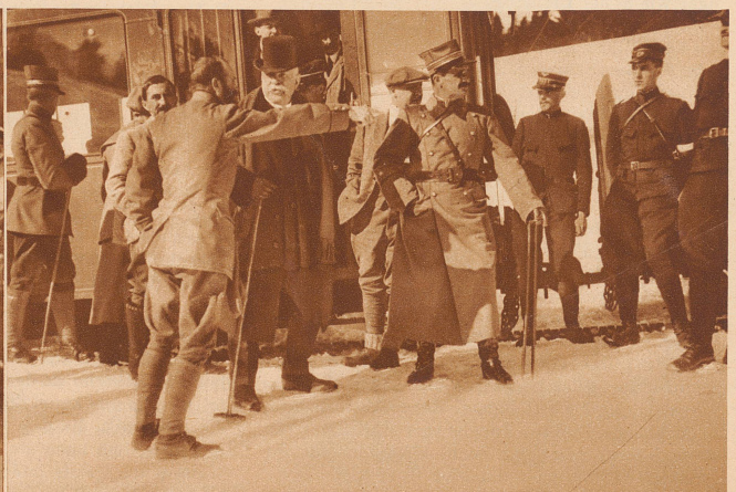
Joffre in militärischer Mission bei den kaiserlich-russischen Manövern 1913. Links im Bilde der Großfürst Nikolaus, in der Mitte der Zar, rechts Joffre