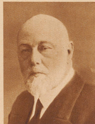
Bankpräsident Alb. Berger eine Persönlichkeit von großer Initiative und allgemeiner Wertschätzung, starb im 67. Altersjahr in Langnau im Emmental. Von 1902—1918 gehörte Berger dem bernischen Grossen Rat an, bis er zum Präsidenten der Bernischen Kantonalbank berufen wurde