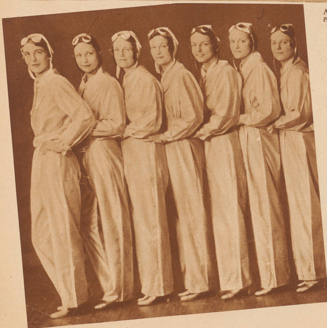
Nebstehend links: Das gibt's bei uns noch nicht. Serviertöchter, die von einer amerikanischen Fluggesellschaft für den Restaurationsbetrieb auf ihren Verkehrsflugzeugen angestellt wurden. Alle tragen die schmucke Fliegertracht