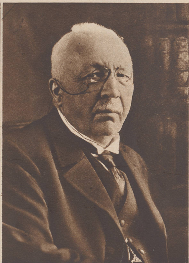
Dr. Virgile Rossel (Bern) 1858—1933 (Präsident 1929—1930)

Avocat, secrétaire du Tribunal cantonal de Zurich; depuis 1908, juge fédéral; fort apprécié comme auteur d'études juridiques.