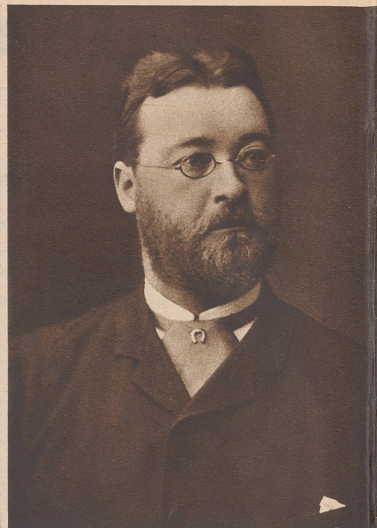
Dr. Charles Soldan (Waadt) 1855—1900 (Präsident 1897—1898)

Adjoint du préfet de Zurich, greffier du Tribunal de Pfäffikon, juge cantonal à Zurich; premier greffier de langue allemande du Tribunal fédéral permanent de 1875 à 1879; ensuite juge fédéral. Il se distingua par ses aptitudes juridiques et une force de travail exceptionnelles. Juge arbitre international.