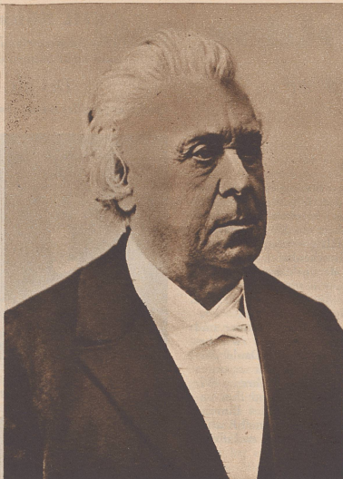
Dr. Joseph Morel (St. Gallen) 1825—1900 (Präsident 1879—1880)

Grand homme d'Etat, juriste et historien éminent; délégué de son canton à la Diète de 1847; membre du Conseil des Etats — qu'il présida trois fois — dès la Constitution de 1848 jusqu'à sa nomination comme membre du Tribunal fédéral permanent, dont il fut le premier président.