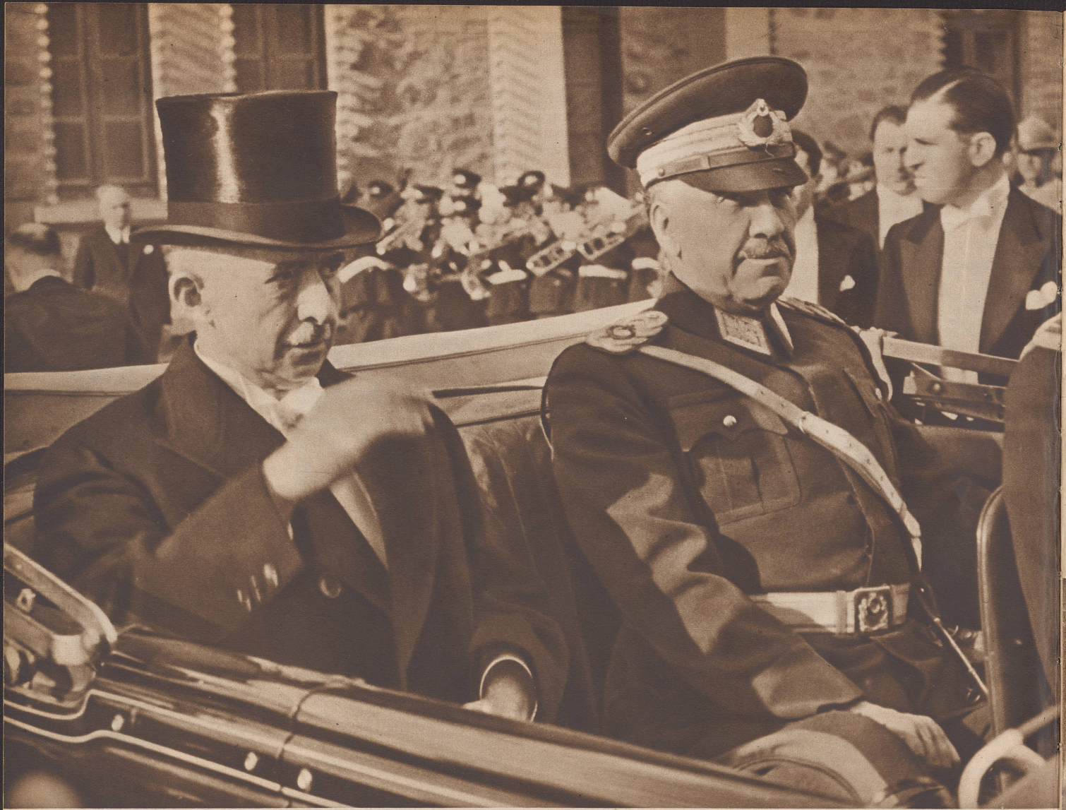
Präsident İnönü fährt mit General Cakmak, dem Höchstkommandierenden der türkischen Armee, zu einer Truppenbesichtigung. Le président İnönü, en compagnie du général Cakmak, chef de l'armée, se rend à une revue militaire.