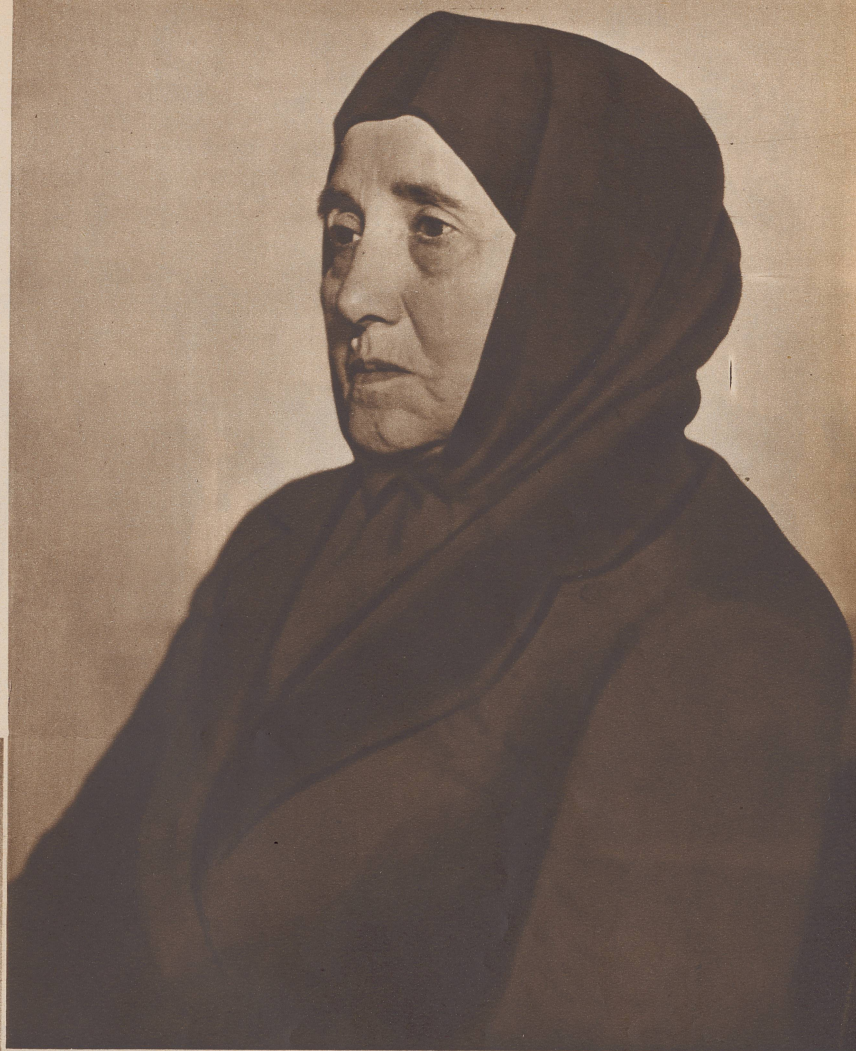
Die Mutter des Präsidenten, eine würdige, vornehme Dame, die sich nach der Mode älterer Frauen mit dem dunklen Kopftuch kleidet.

Chacun, en Turquie, du plus grand au plus petit, connaît le nom d'Ismet Inonu, dont le portrait orne les murs des écoles, des administrations, des commerces, etc. Ismet Inonu, président de la République turque, est le successeur du grand révolutionnaire, Kemal Atatürk qui, avec une volonté et un dynamisme peu communs, construisit sur les ruines du vieil empire ottoman, la jeune et vivante République turque d'aujourd'hui. Ismet Inonu poursuit avec le même courage l'œuvre de son prédécesseur. — Suivant la tradition de la vieille et honorable famille dont il est issu, Ismet Inonu embrassa la carrière militaire et prit part en qualité de général, aux côtés de Kemal Pacha, à la guerre pour l'indépendance de son pays. En souvenir de la victoire remportée en 1921 par les Turques, près de la petite ville d'Inonu, il fut autorisé à porter ce patronyme. Dans ses discours comme dans ses actes, il apporte un grand sérieux et possède à un haut degré le sentiment de sa responsabilité de chef d'Etat. Dans sa vie privée, comme dans sa vie publique, il est un vivant exemple pour tout son peuple.