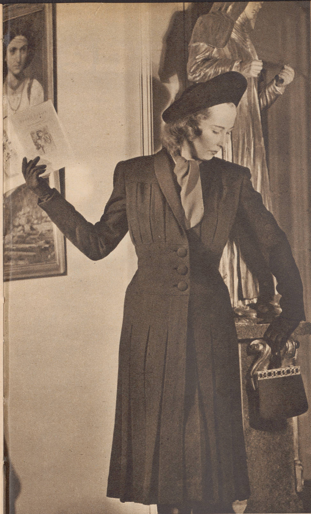
Nur für Schlanke! Ein breit eingearbeitetes Taillenteil, eingelegte Brustfalten und der Rock mit faltenartigem Ausfall verleihen dem schwarzen Mantel besonderen Schick. Pour les minces seulement. Une taille large et travaillée avec plissés sur la poitrine et tombant dans le bas, manteau noir chic et du plus gracieux effet.