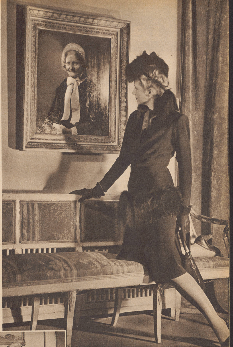
Tailleur aus schwarzem Wollstoff mit Skunksbesatz; das Hütchen ist aus gleichem Material. Tailleur en étoffe de laine noire avec garniture de skunk et chapeau assorti du même matériel.