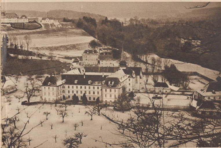
Die Abtei Hauterive, Fribourg. In dieser ehemaligen Zisterzienserabtei, die seit 1857 als Lehrerseminar dient, und wo hauptsächlich ausländische Studenten ihren Studien oblagen, sind internierte katholische Geistliche und Theologiestudenten untergebracht. 1871 wurde hier eine Anzahl Bourbaki-Soldaten interniert.

L'année 1905 vit, en France, l'entrée en vigueur de la loi sur la séparation de l'Eglise et de l'Etat, consécutive à la lutte anticléricale. Dès ce moment, les moines, religieux et prêtres se virent astreints, tout comme les simples citoyens, aux obligations militaires. La France étant le seul pays où les religieux sont soumis à la conscription, la guerre mondiale, puis, celle de 1939 à 1940, virent sous les drapeaux de nombreux prêtres, moines, novices qui payèrent courageusement leur tribut à la guerre. C'est ainsi que, parmi les soldats français internés dans notre pays, se sont trouvés des religieux, des prêtres, des séminaristes. La Suisse a donné à ces hommes la faculté de poursuivre leurs études religieuses, brutalement interrompues, faculté dont ils sont très reconnaissants à notre pays.