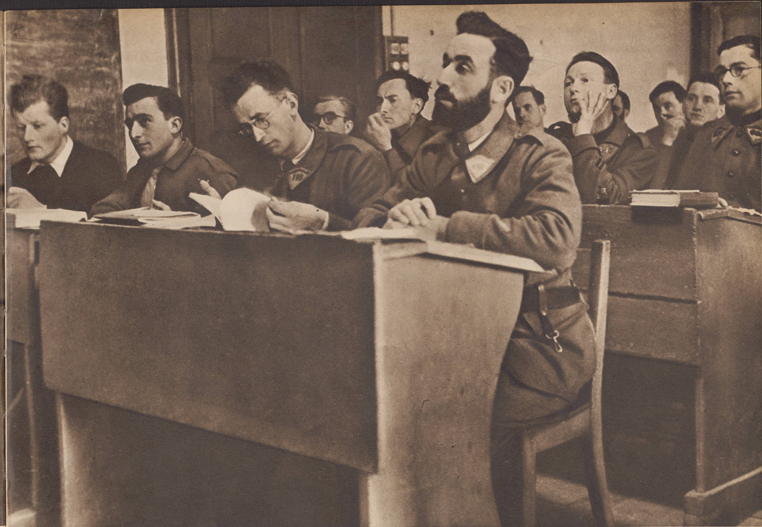
Die Internierten von Hauterive im Theologieseminar. Rund sechzig Theologen sind hier untergebracht, denen die Fortsetzung ihres Studiums durch regelmäßige Kurse ermöglicht wird.

Soixante théologiens environ sont réunis à Hauterive et peuvent y poursuivre régulièrement leurs études.