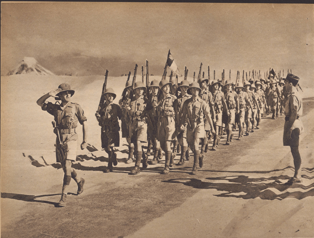
Von der großen französischen Levantarmee, die bis zur Niederlage des Mutterlandes in Syrien stand, haben beim Waffenstillstand zwischen Deutschland und Frankreich einige Einheiten sich der Bewegung des Generals de Gaulle angeschlossen und kämpfen nun auf den afrikanischen Kriegsschauplätzen mit den Engländern gegen die Italiener. Bild: Defilée einer kleinen französischen Abteilung, die ehemals in Syrien stand und nun in der Orientarmee General Wavells kämpft. Die Truppen unterstehen wohl dem Oberkommando Wavells, haben aber ihre eigenen subalternen Offiziere, bilden eigene Formationen und werden von den Engländern ausgerüstet.