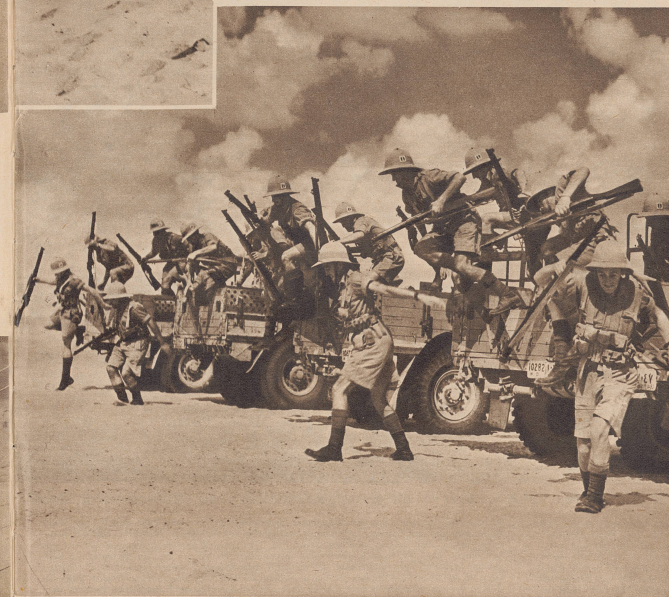
Stellungsbezug einer motorisierten Einheit der freien französischen Truppen auf dem englisch-italienischen Kriegsschauplatz in Nordafrika.

Le difficile problème du ravitaillement dans la guerre du désert. Les mules utilisés enfoncent jusqu'au-dessus du sabot dans le sable, et la température atteint 30 degrés au-dessus de zéro, aussi les soldats sont-ils vêtus très légèrement.