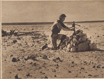
Das Wüstengrab für die fünfköpfige Besatzung eines abgeschossenen italienischen Bombers. Das Kreuz ist aus Trümmern des verbrannten Flugzeuges hergestellt.