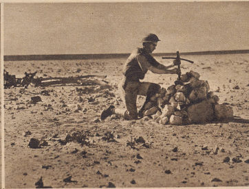
Das Wüstengrab für die fünfköpfige Besatzung eines abgeschossenen italienischen Bombers. Das Kreuz ist aus Trümmern des verbrannten Flugzeuges hergestellt.