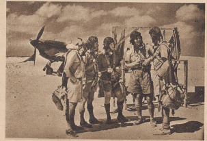
In weit größerem Maße als auf den europäischen Kriegsschauplätzen spielt die Luftwaffe in Afrika eine entscheidende Rolle. Marschierende und ruhende Kolonnen finden im Wüstengelände keine Deckung und sind schonungslos dem Bombenhagel der Flieger ausgesetzt. Bild: Englische Piloten auf einem Stützpunkt in der westlichen Wüste während einer Kampfpause. Die Ausrüstung entspricht den Anforderungen des Wüstenkrieges.