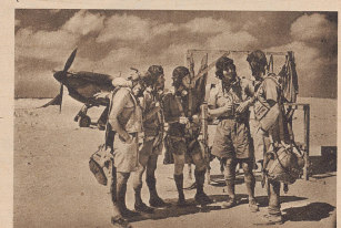
In weit größerem Maße als auf den europäischen Kriegsschauplätzen spielt die Luftwaffe in Afrika eine entscheidende Rolle. Marschierende und ruhende Kolonnen finden im Wüstengelände keine Deckung und sind schonungslos dem Bombenhagel der Flieger ausgesetzt. Bild: Englische Piloten auf einem Stützpunkt in der westlichen Wüste während einer Kampfpause. Die Ausrüstung entspricht den Anforderungen des Wüstenkrieges.

Un appareil de chasse anglais Hurricane en patrouille au-dessus de la mer de sable du désert de Libye. Ces appareils sont munis d'un dispositif spécial de protection contre le sable et la poussière.