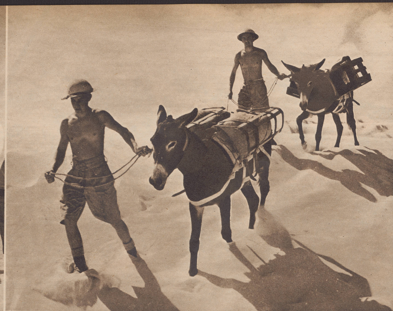
Die schwierigen Nachschubprobleme im Wüstenkrieg. Bis weit über die Hufe sinken die Maultiere auf ihrem Marsch nach vorne im Sande ein. Dazu herrscht hier eine Temperatur von über 30 Grad über Null. Entsprechend sind die Stümersoldaten auch leicht gelei-det.

Le difficile problème du ravitaillement dans la guerre du désert. Les mules utilisés enfoncent jusqu'au-dessus du sabot dans le sable, et la température atteint 30 degrés au-dessus de zéro, aussi les soldats sont-ils vêtus très légèrement.