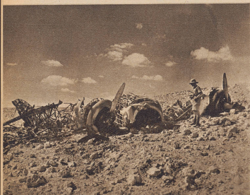
Die Ueberreste eines zwischen Sidi Barani und Marsa Matrui abgeschossenen italienischen Bombers.