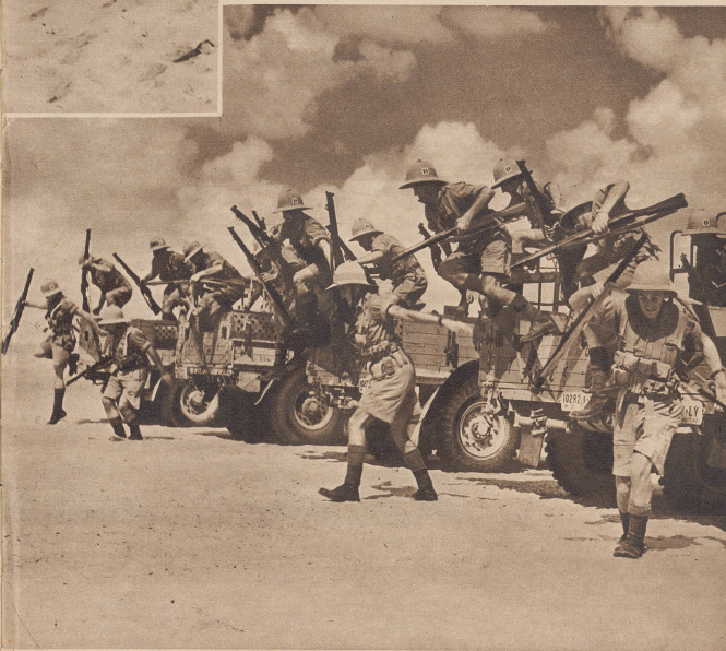
Stellungsbezug einer motorisierten Einheit der freien französischen Truppen auf dem englisch-italienischen Kriegsschauplatz in Nordafrika.