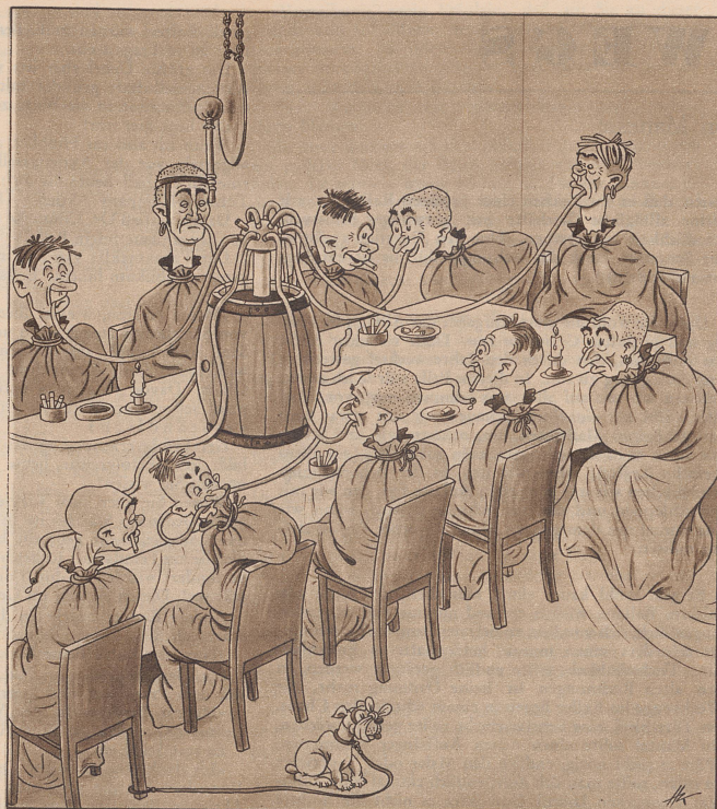
Der Kongress der Taschendiebe. — Le congrès de voleurs à la tire.

«Nein, wissen Sie, die Löwen sind ja so feige, die lassen einen gar nicht an sich rankommen!»