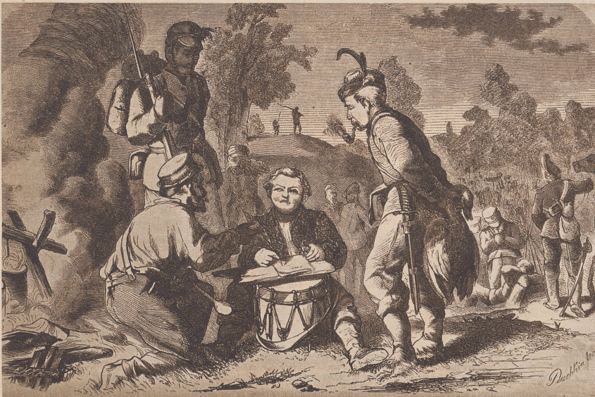
Ueber Land und Meer 1866: «Episode aus dem Kriege zwischen Preußen und Sachsen: Der Briefschreiber im Felde. Es ist klar, daß ein Talent, das es in der schweren Kunst des Schreibens zu einer gewissen Virtuosität gebracht hat, bei der Kompagnie ungemein geschätzt ist. Die Schreibgelegenheit ist die allereinfachste der Welt: der Tambour sitzt auf dem Rasen, zwischen den Beinen hat er die Trommel stehen, über das Fell derselben liegt ein Brett und auf diesem das Briefpapier. So werden die Briefe im Bivouak geschrieben. Sie mögen sich freilich alle ziemlich gleich gewesen sein. Doch was braucht's auch mehr als: Ich bin gesund und lebe noch.»

L'écritain public au bivouac, croquis de la guerre entre la Prusse et la Saxe, tiré d'«Ueber Land und Meer 1866».