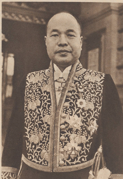
Minister Takanobu Mitani der neue japanische Gesandte in Bern. S. E. M. Takanobu Mitani, ministre du Japon, qui vient de présenter ses lettres de créance à Berne.

Du «Buch für Alle 1887». A Bedloe's Island, dans le port de New-York, on procède aux derniers travaux de la statue monumentale de la «liberté éclairant le monde», offerte par le peuple de France aux citoyens américains à l'occasion du centenaire de l'indépendance des Etats-Unis. Cette œuvre, due au sculpteur parisien Bartholdy, est revêtue de plaques de cuivre battus, de 2 1/2 millimètres d'épaisseur. Elle ne pèse pas moins de 200 tonnes et mesurait quand elle fut terminée plus de 46 mètres de la base au sommet du flambeau.