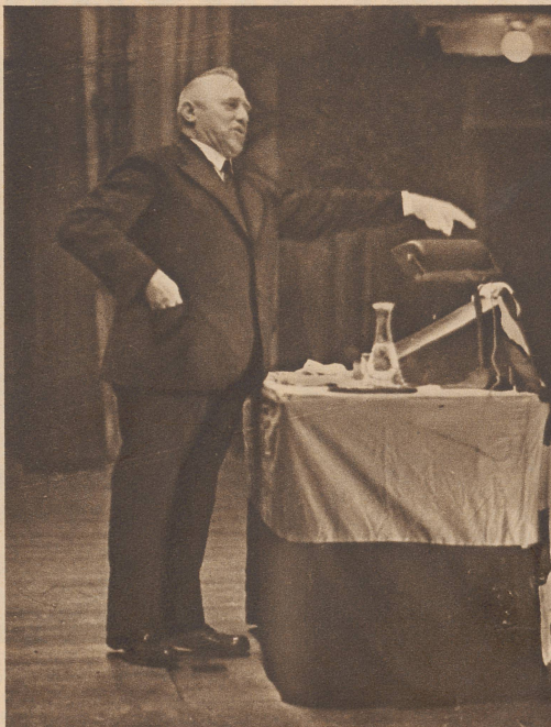
Bundesrat Rudolf Minger

seit 1929 Vorsteher des Eidg. Militärdepartements. M. le conseiller fédéral Rudolf Minger, chef du département Militaire, élu en 1929.