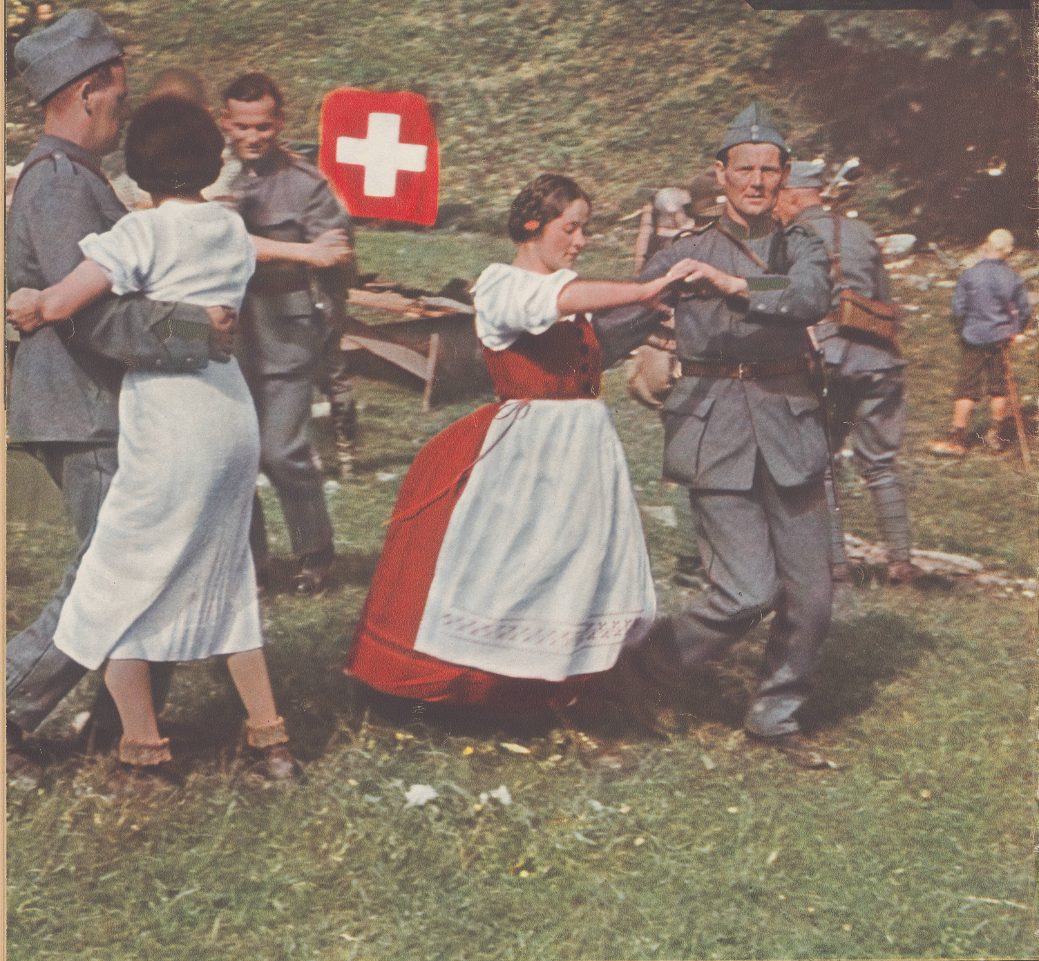
Photocolor-Tiefdruck Conzett & Huber, Zürich — VI S 5784