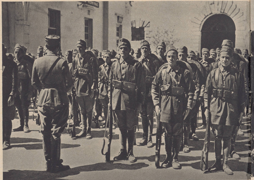
Griechische Festungssoldaten bei einem Appell vor dem Ausrücken. Der Friedensbestand der griechischen Armee beträgt rund 60 000 Mann und kann im Kriege auf 450 000 Mann gesteigert werden.

La plus grosse unité de la flotte grecque est le croiseur-cuirassé «Georgios Averoff». Lancé en 1910, il jauge 9450 tonnes, est armé de quatre pièces de 23 cm., huit de 19 cm., quatre de 7,6 et de trois tubes lance-torpilles. La flotte hellénique comprend en outre un mouilleur de mines, 10 grands et 13 petits torpilleurs et 6 sous-marins.