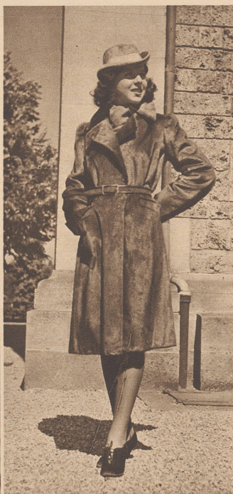
Sportmantel aus rehbraunem Otterpelz. Loutre de rivière.