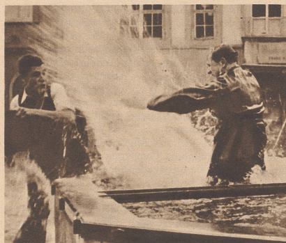
Aber er wehrt sich und spritzt! Le baigneur, malgré lui, entreprend aussitôt de se défendre.