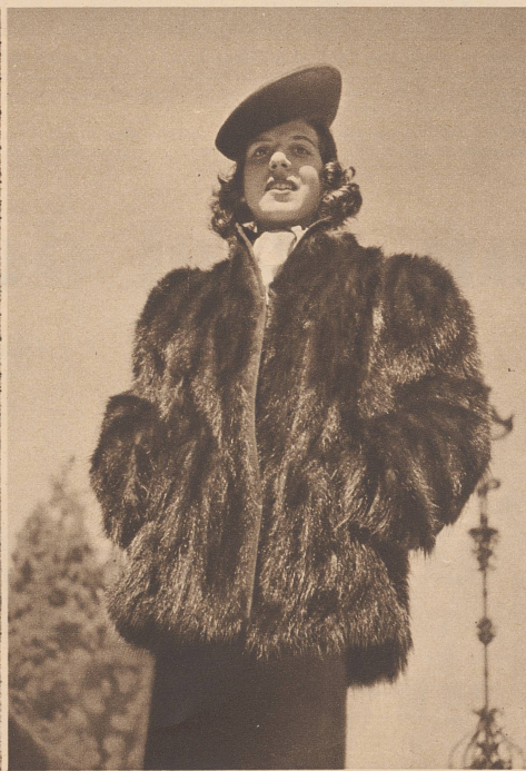
Dunkelbraune Opossumjacke in loser Form mit kleidsamer Stoffbordüre. Opossum.