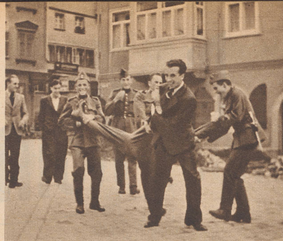
Plötzlich ist ein Ahnungsloser gepackt worden... Soudain ils se saisissent d'un de leurs camarades...

Die französische Regierung hat nach Kenntnisnahme eines — naturgemäß nur höchst unverbildlichen — Voranschlags einen Betrag von 204 Millionen Francs bewilligt, der für die Wiederherstellung der durch Kriegshandlungen beschädigten oder zerstörten Bauten und historischen Monumente verwendet werden soll. Natürlich handelt es sich hier lediglich um den auf das Jahr 1940 entfallenden Budgetposten, da die vollständige Beseitigung und Wiedergutmachung der Zerstörungen wohl ein Vielfaches dieses Betrages beanspruchen wird.