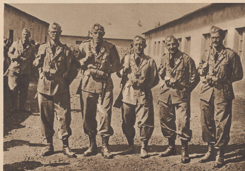
Deutsche in Abessinien

Abessinierndeutsche haben sich in der Stärke von zwei Kompagnien den italienischen Truppen angeschlossen, um auf ihrer Seite an den Kämpfen in Afrika teilzunehmen. Les Allemands qui résident en Abyssinie ont formé deux compagnies qui combattent aux côtés des forces italiennes.