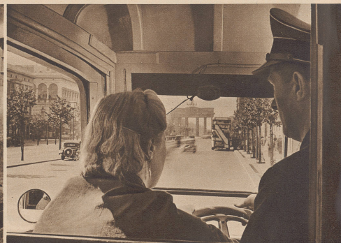
Frauen ersetzen die Männer

Abessinierndeutsche haben sich in der Stärke von zwei Kompagnien den italienischen Truppen angeschlossen, um auf ihrer Seite an den Kämpfen in Afrika teilzunehmen. Les Allemands qui résident en Abyssinie ont formé deux compagnies qui combattent aux côtés des forces italiennes.