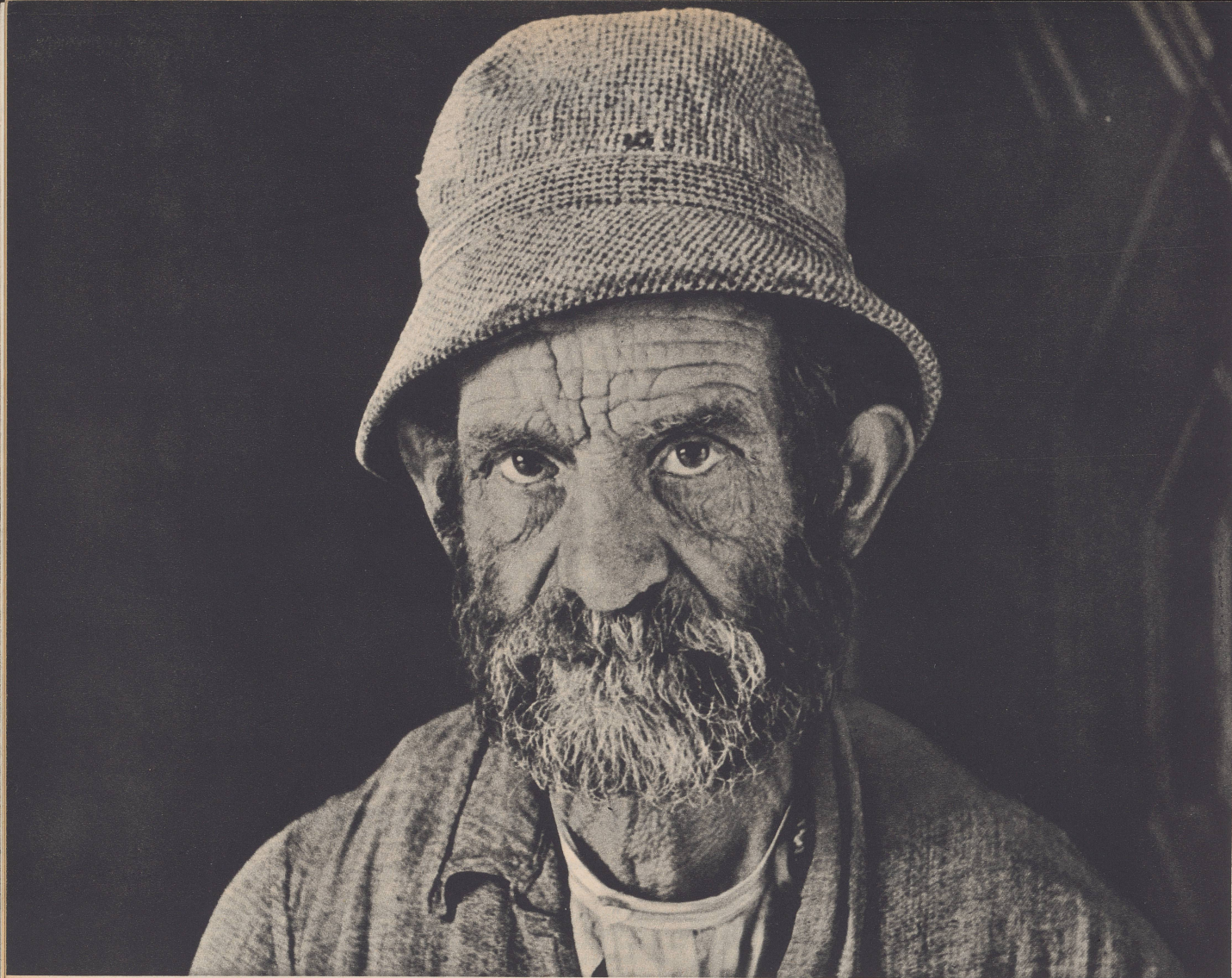
Bündnerischer Bauer, der nach einem arbeitsreichen Dasein seinen Lebensabend im Altersheim verbringt. — Après avoir durement peiné toute sa vie, ce paysan grison goûte à l'asile d'un repos bien mérité.