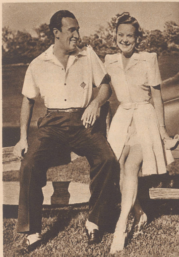
In Chicago: Fräulein Sonja Henie, die bekannte Eiskunstläuferin und Filmschauspielerin, mit dem Sportmann Dan Topping.