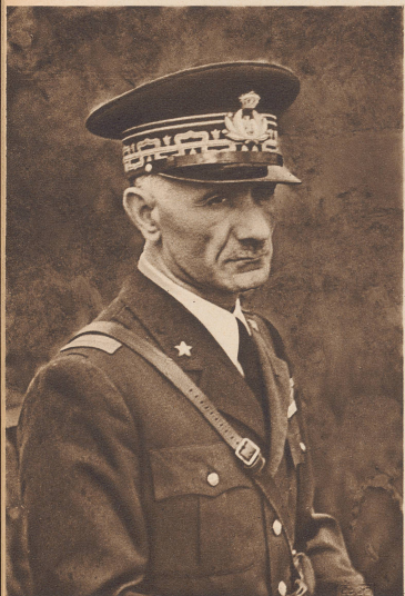
General Francesco Pricolo

S. A. R. et I. Humbert de Savoie, Prince de Piémont, héritier de la Couronne d'Italie, inspecteur général de l'infanterie et chef des armées du Nord.