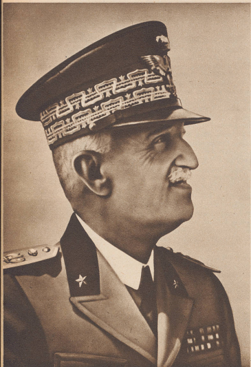
Viktor Emanuel III.

König von Italien und Kaiser von Äthiopien, oberster Befehlshaber aller italienischen Land-, See- und Luftstreitkräfte. S. M. Victor-Emmanuel III, roi d'Italie et empereur d'Éthiopie, chef suprême des armées de terre, de mer et de l'air.