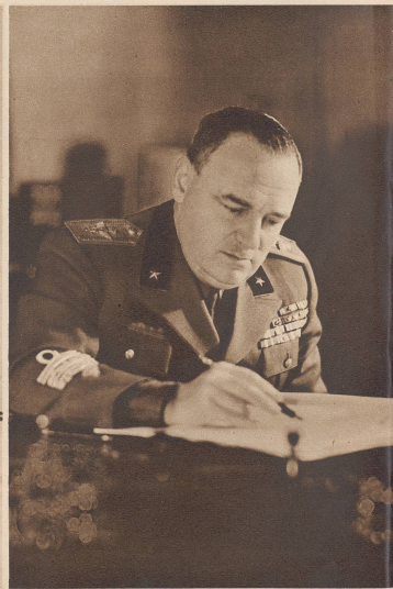
General Ubaldo Soddu

Generalstabschef der Marine. Amiral Domenico Cavagnari, chef de l'E. M. G. de la marine.