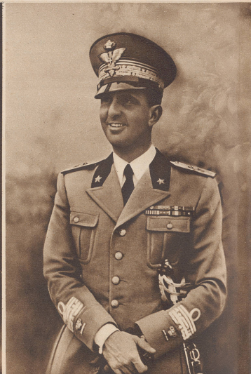
Umberto di Savoia

Ministerpräsident, Kriegsminister, Kommandant sämtlicher Truppen auf allen Fronten und Erster Marschall des Imperiums. S. E. Benito Mussolini, président du conseil des ministres, ministre de la guerre, commandant en chef des troupes combattantes sur tous les fronts, premier maréchal de l'Empire.