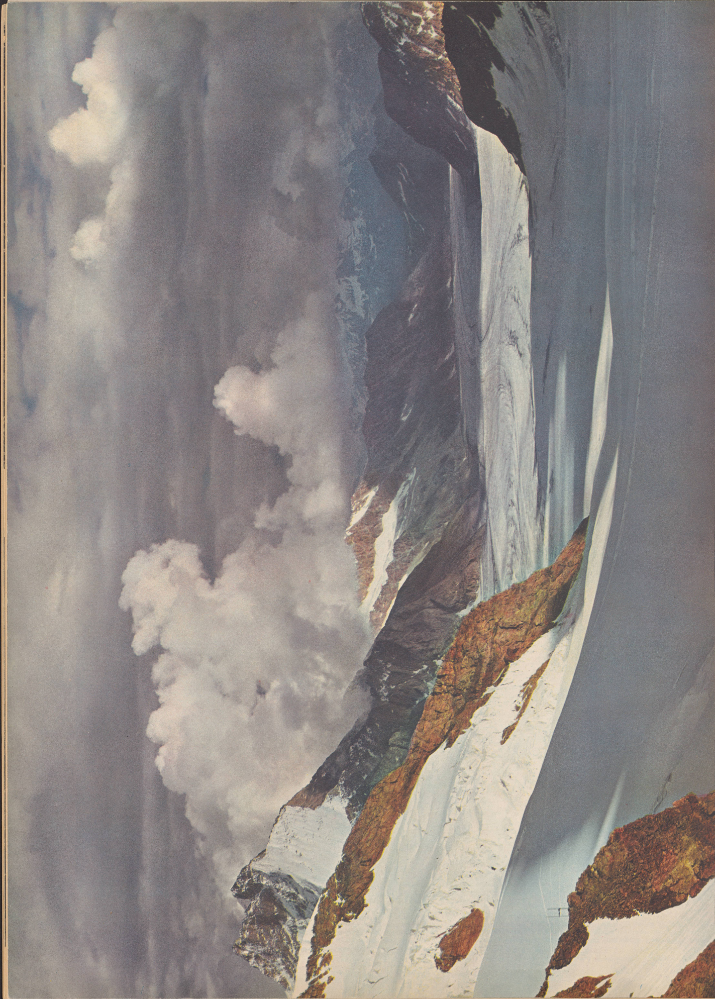
Der große Aletschgletscher im Abendlicht, vom Jungfraujoch aus gesehen «Salut glaciers sublimes.» Le glacier d'Aletsch, vu du Jungfraujoch