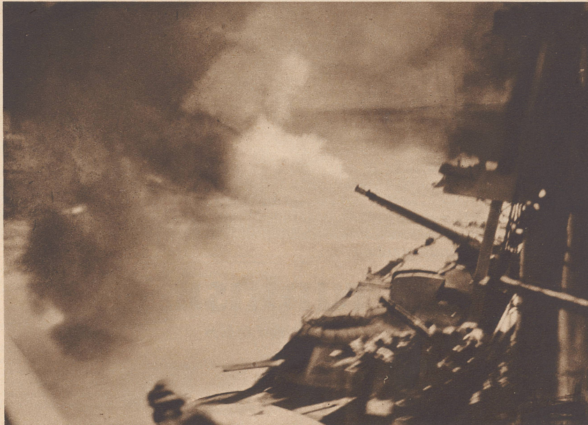
Das italienische Schlachtschiff «Giulio Cesare» im Gefecht.

En mer ionienne s'engageait, le 9 juillet, le premier combat naval italo-anglais, combat au cours duquel les Italiens perdirent le torpilleur «Zeffiro», tandis que les Anglais voyaient couler deux de leurs destroyers. Photo: Une salve du croiseur de bataille italien «Cavour».