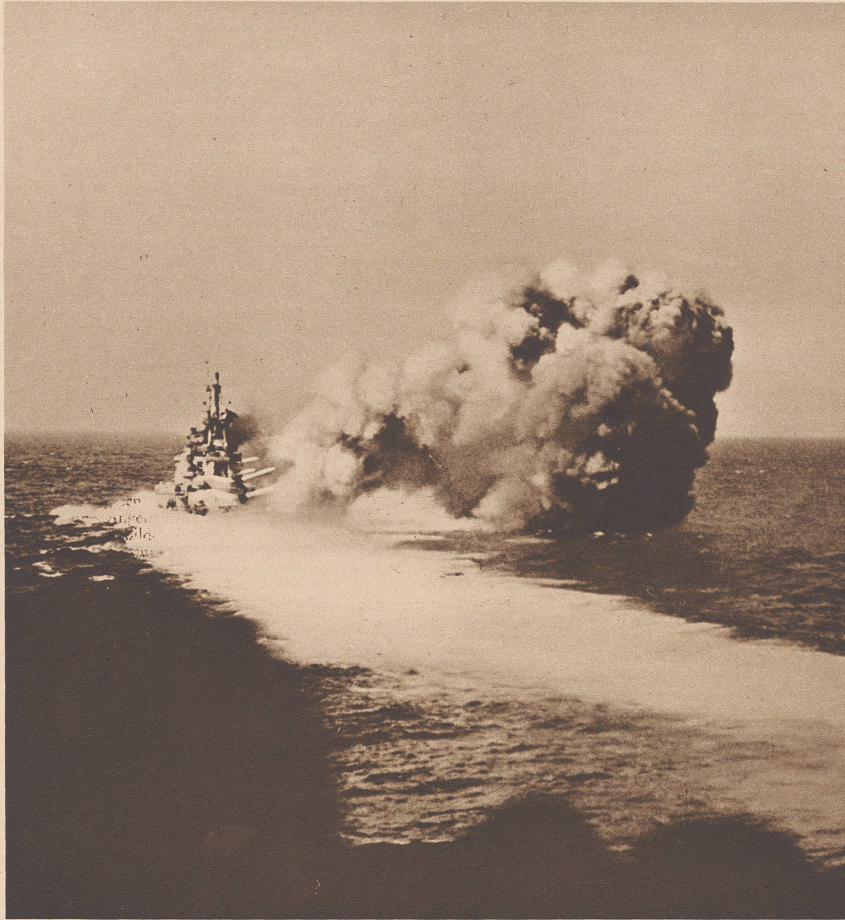
Eine Salve des italienischen Schlachtschiffes «Cavour» beim Seegefecht im Ionischen Meer am 9. Juli, 14 Uhr. Ueber den Ausgang dieses ersten großen Treffens zwischen italienischen und britischen Einheiten liegen vollständig widersprechende Nachrichten vor. Italienischerseits soll der Zerstörer «Zeffiro» gesunken sein. Die Engländer verloren zwei Einheiten.

En mer ionienne s'engageait, le 9 juillet, le premier combat naval italo-anglais, combat au cours duquel les Italiens perdirent le torpilleur «Zeffiro», tandis que les Anglais voyaient couler deux de leurs destroyers. Photo: Une salve du croiseur de bataille italien «Cavour».