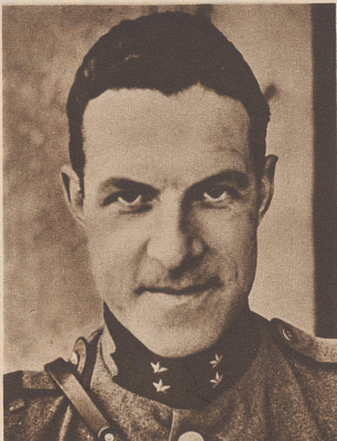
† Oberleutnant Emil Gürtler. VI Kr 3119

Le samedi 8 juin, un avion suisse d'observation se heurte à six avions allemands au-dessus de l'Ajoie et est abattu aux environs d'Alle. L'équipage, le pilote Meuli et l'observateur Gürtler, sont tués.