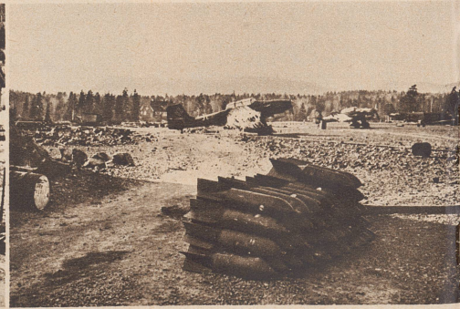
Deutsche Flugzeuge und Stapel von Fliegerbomben auf einem norwegischen Flugplatz. Avions allemands et bombes d'aviation, sur un aéroport norvégien.